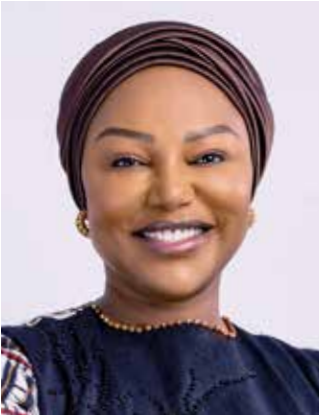
Nassénéba Touré Ministre de la Femme, de la Famille et de l'Enfant

Il y a des moments où l'on s'arrête, non pas pour souffler, mais pour visualiser les acquis. Ce magazine est l'un de ces moments. En le feuilletant, vous ne lirez pas de promesses. Vous lirez des actes portés par une conviction que je défends chaque jour avec la même ardeur : une Côte d'Ivoire qui protège ses femmes, ses familles et ses enfants est une Côte d'Ivoire qui se construit sur des fondations solides, pour aujourd'hui et pour les générations qui viendront après nous.