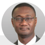
M. MOUSSA SANOGO MINISTRE DE L'URBANISME, DU LOGEMENT ET DU CADRE DE VIE