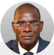
GÉNÉRAL VAGONDO DIOMANDÉ MINISTRE DE L'INTÉRIEUR ET DE LA SÉCURITÉ