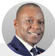
M. AMADOU KONÉ MINISTRE DES TRANSPORTS ET DES AFFAIRES MARITIMES