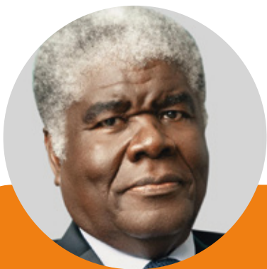
M. ROBERT BEUGRÉ MAMBÉ PREMIER MINISTRE, CHEF DU GOUVERNEMENT