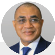
M. ADAMA COULIBALY MINISTRE DE L'ÉCONOMIE, DES FINANCES ET DU BUDGET