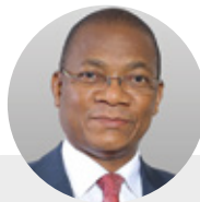
M. BRUNO NABAGNÉ KONÉ MINISTRE DE L'AGRICULTURE, DU DÉVELOPPEMENT RURAL ET DES PRODUCTIONS VIVIÈRES